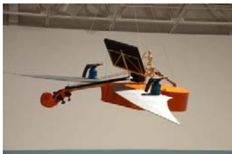
Flying Bass II (Installationsansicht), 2010

Kontrabass, Metallic-Tinte, Propangasbrenner, verschiedene Materialien