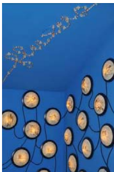
Fluxus Constellation, 2003

Siebdruck auf Nylon, Wandleuchten aus Glas, elektrisches System, Lichtschlauch