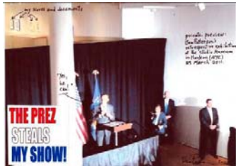
The Prez Steals My Show

Barack Obama in der Ausstellung Benjamin Patterson: Born in the State of FLUX/us im Studio Museum Harlem, New York, 29. März 2011