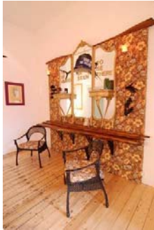
Benjamin Patterson: Ben's Bar. Why People Attend Bars: To Be Heard, To Be Seen, To Be There, 1990 / 2007