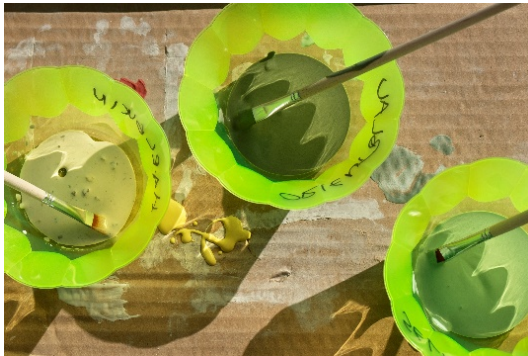
Schüler:innen entdecken zeitgenössische Kunst, 2021 Brückenschule Wiesbaden

Bitte beachten Sie das Copyright. Die Verwendung des Bildes im Zusammenhang mit der Berichterstattung über die Ausstellung ist frei. Gerne stellen wir Ihnen das Bild in druckfähiger Auflösung zur Verfügung. Im Gegenzug freuen wir uns über die Zusendung eines Belegexemplars/Beleglinks.