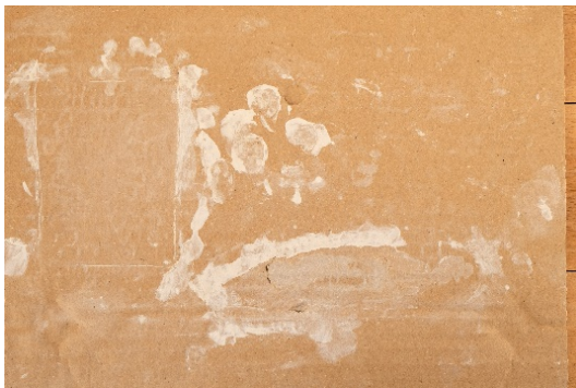
Schüler:innen entdecken zeitgenössische Kunst, 2021 Brückenschule Wiesbaden