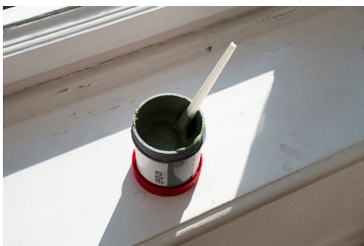
Schüler:innen entdecken zeitgenössische Kunst, 2021 Brückenschule Wiesbaden